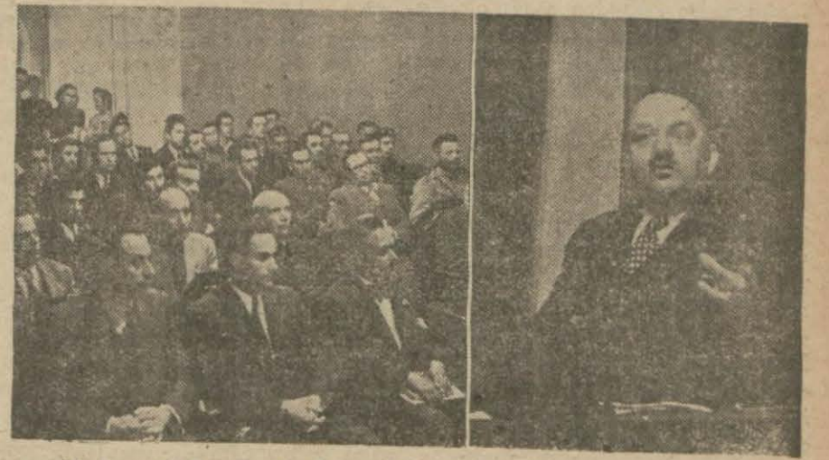
Mahmud Esad Bozkurt dünkü konferansı esnasında

İzmir meb'usu profesör Mahmud Esad Bozkurt dün saat 18 de Beyoğlu Halkkevinde "Silâhlı Cumhuriyet" mevzulu çok şayanı dikkatli konferans vermiştir. Konferans, kalabalık bir münevver ve gençlik kütlesi tarafından (Devamı 4/1 de)