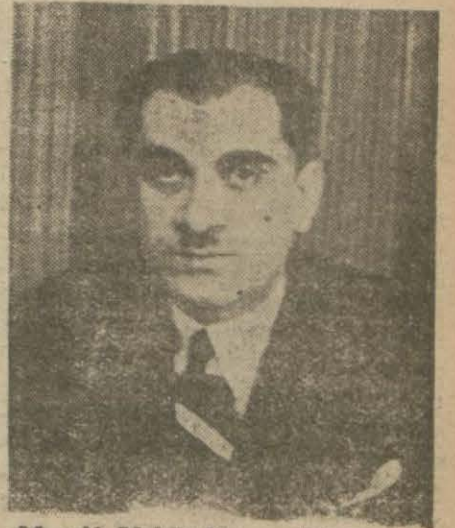
Maarif Vekili Hasan Ali Yücel

Bugün Türkiye toprakları üstünde on yedi yerde iki yıl içerisinde 9000 çocuğu, köylü çocuğunu içerisine almış olan bu müesseseler iyi çalışmakta ve muvaffak çalışmaktadır. Bu çocuklar ders okuyacak dersanelerini kendileri yaparlar, yatacakları yatakhaneleri kendileri yaparlar, çalışacakları atölyelerin duvarını, damını kendileri yaparlar ve kendi yaptıkları (Devamı 5 inci sayfada)