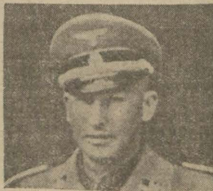
Heydrich (Yazısı 5 inci sayfada)